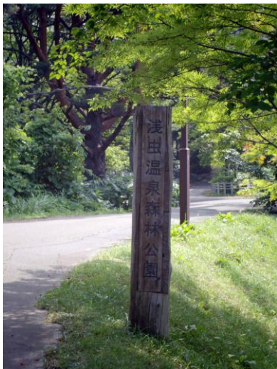
浅虫温泉森林公園の案内板

浅虫温泉森林公園は、市内東部に位置し、昭和 60 年（1985）に生活環境保全林として設置されました。「森林浴の森・日本 100 選」に選ばれ、コナラ・ミズナラ・クリ・ブナ・ホオノキなどの落葉広葉樹に、アカマツ・カラマツ・アオモリトドマツ・スギなどの針葉樹におおわれ、野鳥の良好な生息環境となっています。園内は、樹林の中を散策できるよう約 10 キロメートルの遊歩道が整備され、県営浅虫水族館付近、浅虫温泉駅近く、浅虫ダム・ほたる湖などからの入り口があり、いろいろなコースを楽しめます。