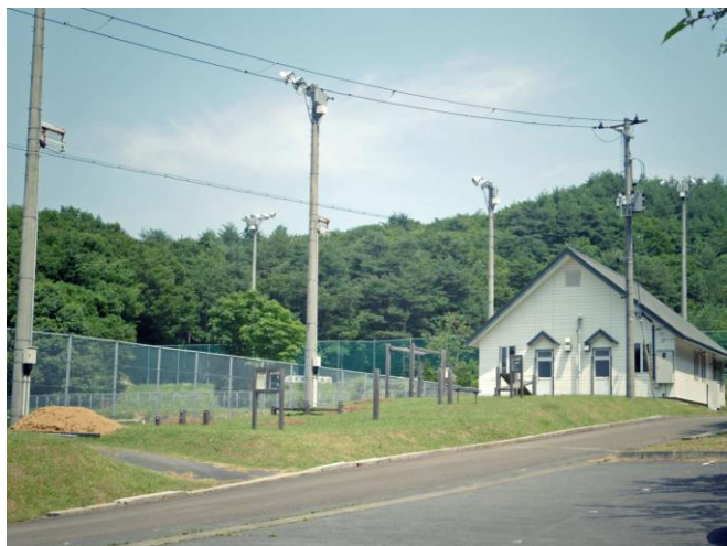
総合案内所と運動広場

また、水族館付近の遊歩道入り口に公園の総合案内所があり、その隣にテニスコートや運動広場の施設があり、スポーツも楽しめます。