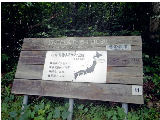
アカマツ巨樹の看板