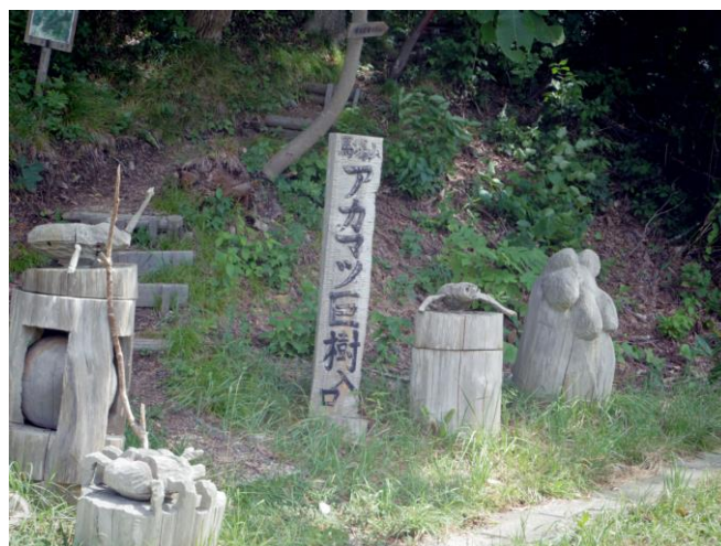
馬場山アカマツ巨樹入口