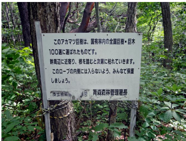
アカマツ巨樹の保護看板