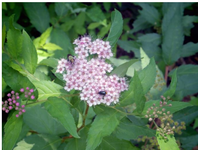
遊歩道沿いに咲く花

このように四季折々に、森林浴、バードウォッチング、ハイキング、スポーツと楽しめる浅虫温泉森林公園へ足を運んでみませんか。