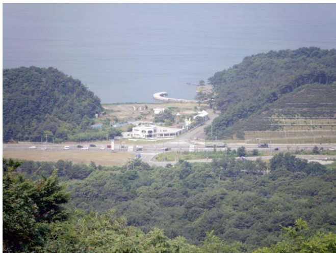
陸奥湾展望所から陸奥湾を臨む