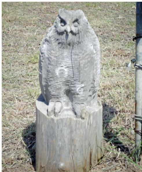
彫刻公園入口にあるふくろうさん

「くり見本園」や「あじさいロード」を通り、さらに西へ行くと、林野庁が平成12年（2000）4月に全国の「巨樹・巨木100選」に選ばれた、樹齢推定700年以上の「馬場山アカマツ巨樹」があります。幹周り660センチメートル、樹高28メートルで、枝を四方に広げ威風堂々とした巨木は、公園内の見所の一つで隠れた名所です。