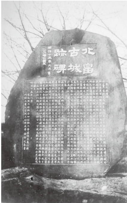
北畠古城跡碑（有栖川宮熾仁親王題字）

城はいづ誰が造ったか？ 城跡は、昭和15年（1940）2月10日、皇紀二千六百年となる紀元節の前日に県内初の国史跡に指定されています。この時の指定書には、南朝の忠臣・北畠氏の末裔である浪岡氏が天正6年（157