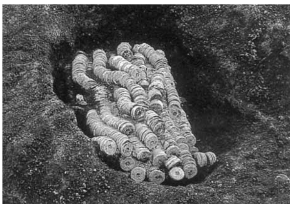
内館の銭縷の出土例（5,971枚）