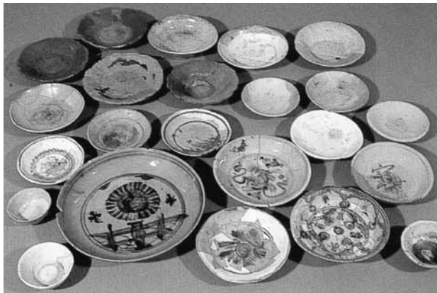
出土した中国製の陶磁器

の建物が、数時期にわたって重複しながら存在していました。これらの建物は、屋敷とみられる空間に井戸などとともに建築され、柱の間隔や位置関係から特定された時期については、復元図を作ることができました。